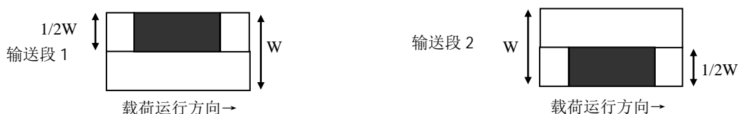
图 1 动态偏载试验区域示意图

载荷在承载器上通过 6.2.3 中规定的次数。分检仪示值与载荷质量值之差为偏载误差。